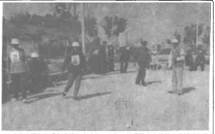
广北农场老龄委积极组织离退休干部职工开展健康有益的文体活动。他们投资建起门球场、乒乓球台和多种棋类，定期组织比赛，让离退休干部职工晚年生活充实又欢乐。