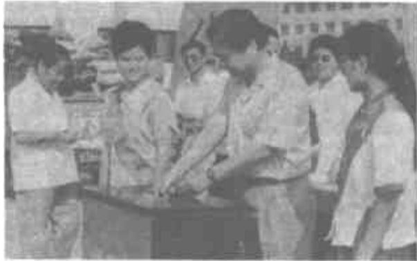
图为市领导在为灾区捐款。

市供销社 本报讯 市供销社干部职工积极开展“我为灾区献爱心,救助灾区捐赠”活动。全商场50名员工争先恐后,踊跃捐款捐物,总价值折合人民币1.5万多元。(孙军)